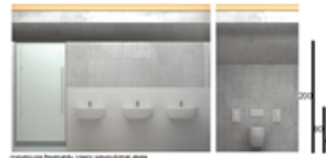
Interiér toalety, výhled zvnějšku směrem