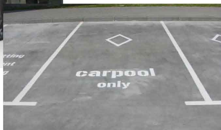
Borg Warner Turbo Systems Poland