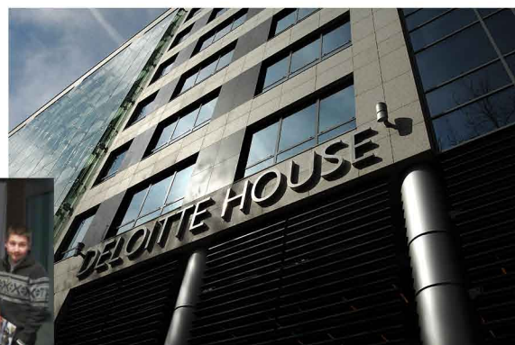
Skanska Property Poland