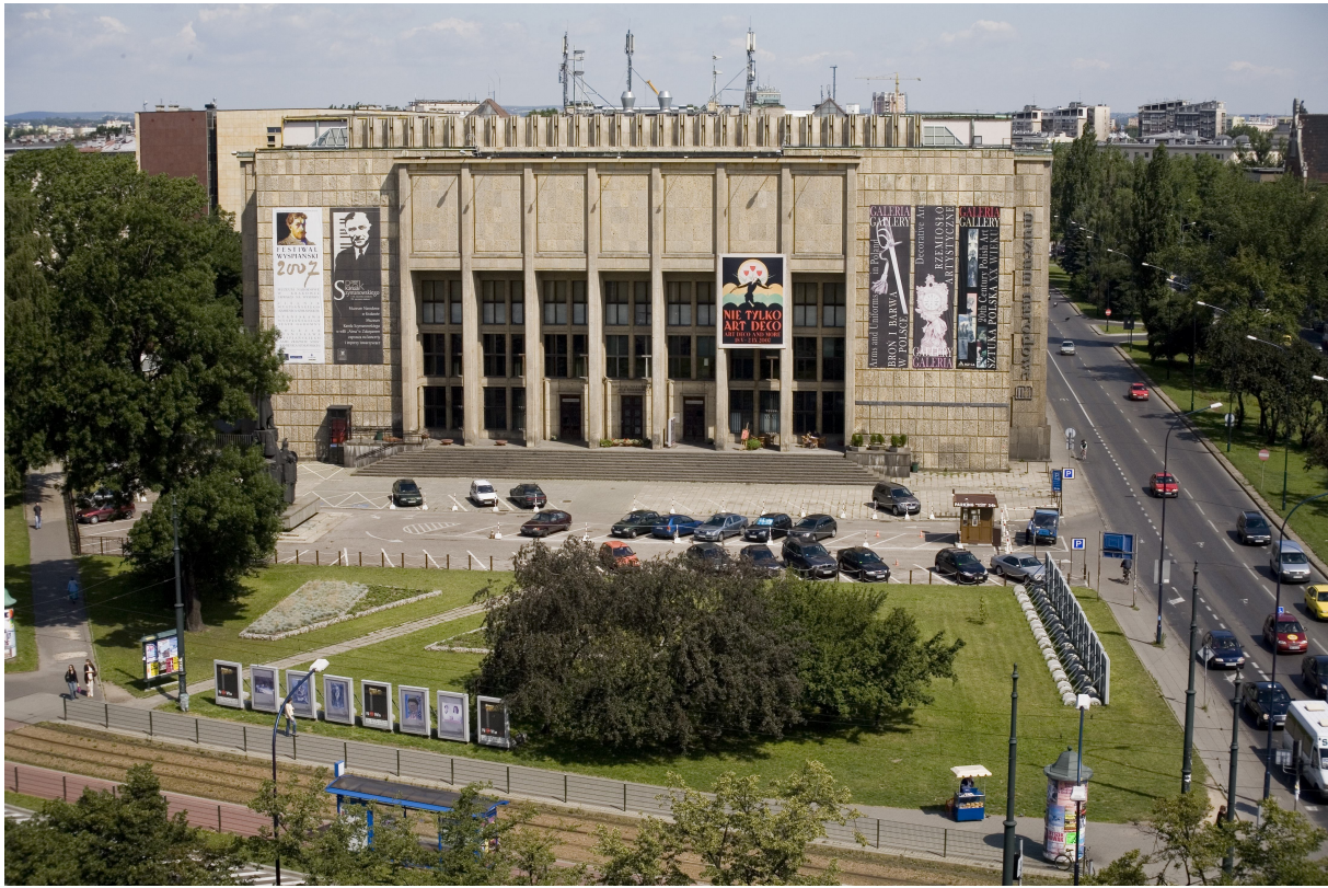
Fot. 1. Widok placu przed Muzeum Narodowym w Krakowie – stan obecny